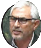
نماینده مردم نهپندان و سریشه: در منابع اسیال هم هنوز طرح توسعه نهپندان اعتباری ندارد