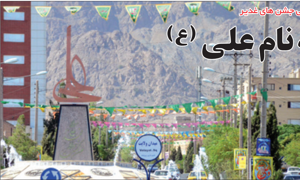
قیام تمام قد مساجد و اوقاف در برپایی جشن های غدیر