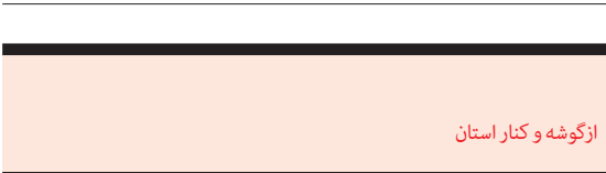
ازگوشه و کنار استان