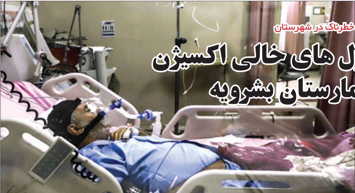
دور همی های خطرناک در شهرستان

مهندس «بهی» ادامه داد: با برگردان سایت های تلفن خانگی روستایی شرکت کوه نور به شبکه ایرنسل، این عملیات در چهار سایت روستاهای نیاب، باغ سنگی، مود علیا و چشمه رج شهرستان سربیشه نیز انجام شد و سایت های تلفن خانگی این روستاها به فناوری نسل سوم همراه تجهیز شدند.