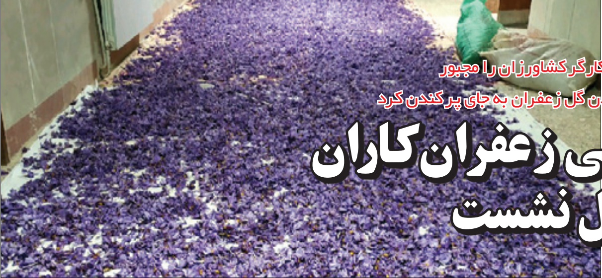
کرونا و نبود کارگر کشاورزان را مجبور

«کیان پور» تبدیل آبنما به پل، اجرای ۲ باب استراحتگاه بین راهی رانندگان، تکمیل اصلاح پیچ پر حادثه، احداث ۱۴ دستگاه پل، ترمیم خسارات وارد شده به ابنیه فنی ناشی از سیل در طول حوزه استحفاظی اداره دیهوک، تجهیز و راه اندازی راهدارخانه دیگر رستمر از پروژه های اجرایی اداره نام‌برد.