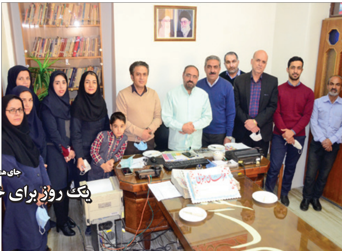
جای همکاران خالی