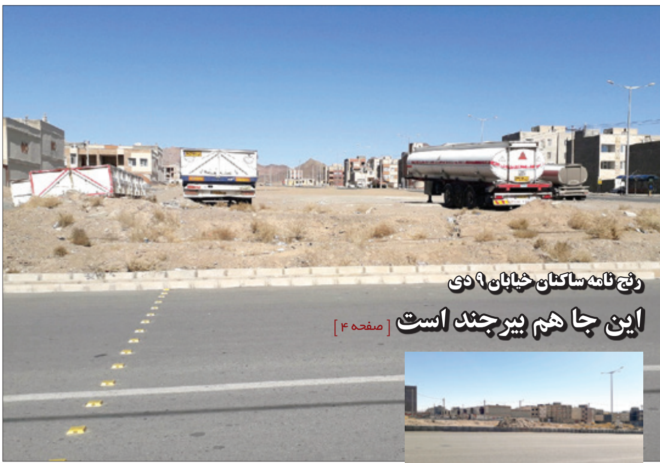
رنج نامه ساکنان خیابان ۹ دی