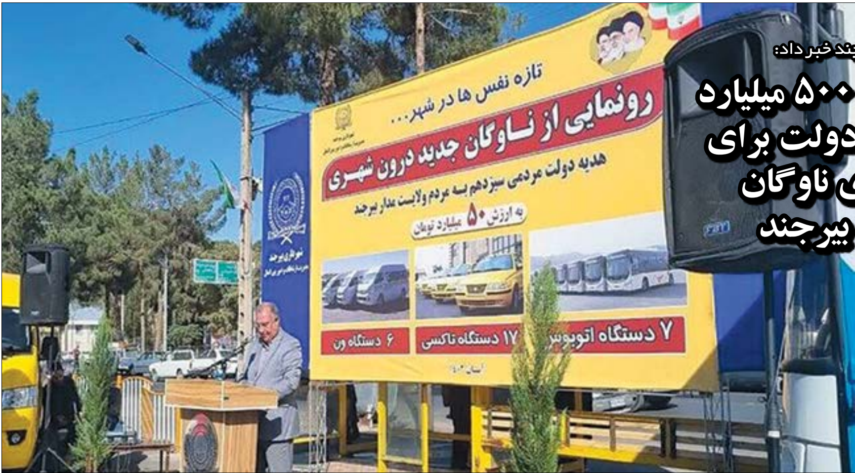
شهردار بیرجند خبر داد:

کمک ۵۰۰ میلیارد ریالی دولت برای نوسازی ناوگان شهری بیرجند