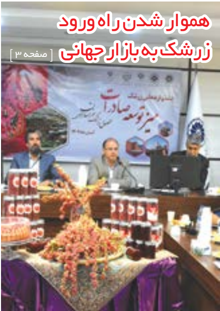
هموار شدن راه ورود زرشک به بازار جهانی

۹ تفاهم نامه در اختتامیه جشنواره ملی زرشک منعقد می شود