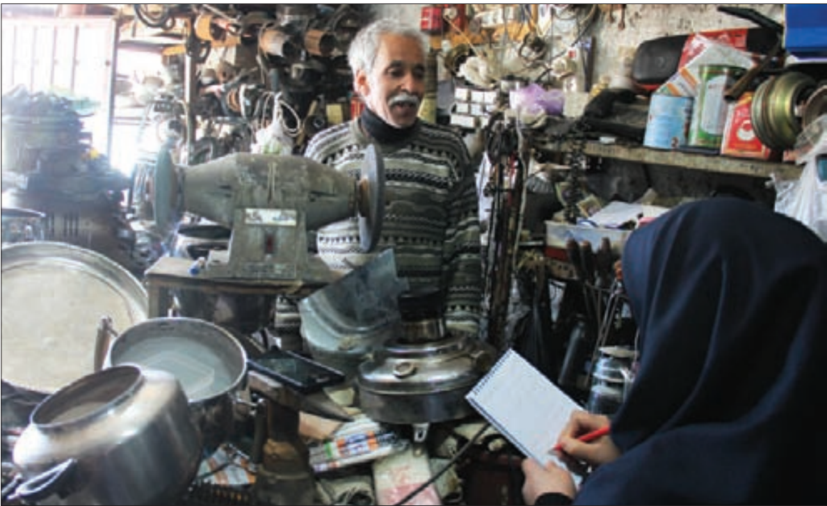
پای صحبت چراغ ساز قدیمی بیرجند

او می گوید: متولد ۱۳۳۲ و اهل محله خیرآباد بیرجند