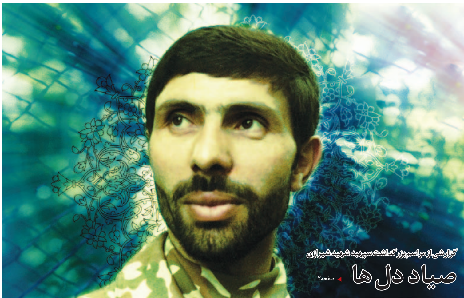
گزارشی از مراسم روز گشت سپیدک شمشیر شیری