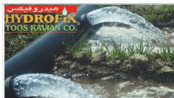
لوله هیدرو فیکس در چاه دار

مشاوره وام ۱۵۰ و ۱۰۰ م با مدارک تحصیلی و یا مدارک مهارت و یا جواز کسب تماس: شبه تا چهارشنبه ۹ الی ۱۴ ۰۲۱-۴۴۹۷۶۲۹۵