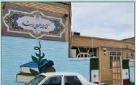
کتابخانه عمومی ارشاد: