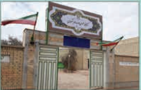
کتابخانه عمومی ملا عبدا... بشروی:

بشرویه، خیابان ملا عبدا... تونی - تونی ۱۵