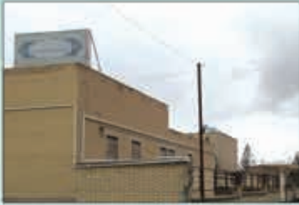
کتابخانه عمومی استاد احمدی بیرجندی: شهرستان درمیان

اسدیه، سایت اداری، خیابان فرهنگ، جنب فرمانداری