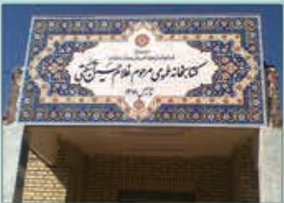
کتابخانه عمومی غلامحسین آسگتی: