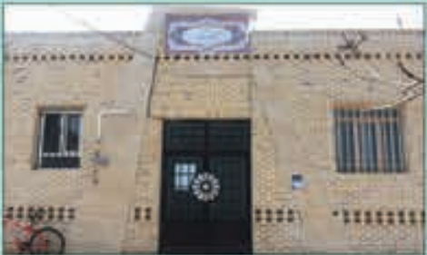
کتابخانه عمومی قائم (عج):