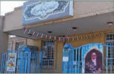
کتابخانه عمومی دکتر غلامحسین شکوهی:

اسدیه، سایت اداری، خیابان فرهنگ، جنب فرمانداری