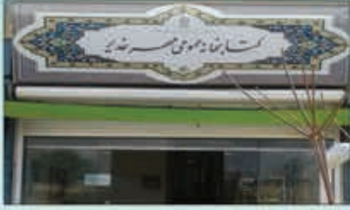
کتابخانه عمومی مهر غدیر: فاین، بلوار دانشگاه