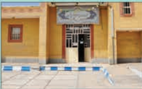
کتابخانه عمومی شیخ محسن فقیه: شهرستان زیرکوه حاجی آباد، بلوار پیروزی، خیابان ارشاد

بشرویه، خیابان ملا عبدا... تونی - تونی ۱۵