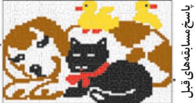
پاسخ مسابقه های قبل

«ویل شورتز» که آن زمان از دست اندرکاران مجله معروف گیمز و طراح معماهای رادیوی دولتی آمریکا بود، با پشتیبانی ناشر مجله و انتشارات تایمز بوکس در سال ۱۹۹۱ با تعدادی از نهادهایی که می توانستند برگزار کننده مسابقات باشند