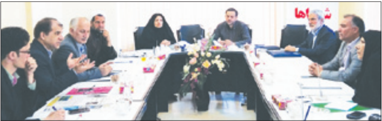
بررسی ۴ پرونده در شورای شهر