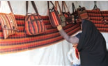
نیمه اول سال محقق شد