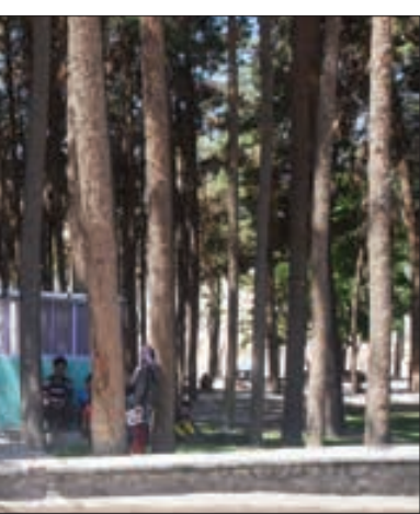
در حاشیه پارک بوستان قلعه

رنجبر ـ درختان سر به فلک کشیده و سبز کاج چهره شهر را زيبا کرده است و سرما هم نمی تواند اين درختان مقاوم را از پا در بياورد. شهر بزرگ و نام «شهر کاج ها» می شناسند و تنها رنگ و نقش قالب در اين تابلوی نقاشی شده به دست خالق هستی کاج های بلندی است که سر به آسمان نهاده اند. دستن باغبانان ۵۵ سال پیش ریشه های نخفیه نهال های کاج را با ظرافت داخل خاک نمناک کاشت تا قد بکشند و سايه ای شوند بر سر رهگذران و پرده سبز رنگ برگ های سوزنی اش شهر را سبز و زيبا کند. اما از گذشته ها، مردم بير چند صحت هايی در باره ویژگی های درختان کاج داشته و دارند، برخی ها می گویند درختان کاج بعد از بارش باران سسمی از خود ساطع می کنند که مسموميت به دنبال دارد و اين درختان در حال حاضر زیر سایه همين تصورات اشتباه قد می کشد و موردی مهري شهروندان است. معذی در یکی از شهروندان می گوید: از قدیم در بير چند به کاشت درختان کاج همت می شد اما به نظرم در دسر های اين درختان بيشتر از خاصيت های آن است. يکی ديگر از شهروندان بير جندی می گوید: