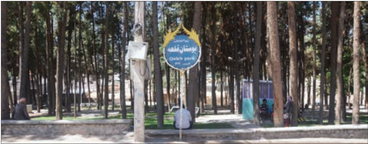
در حاشیه پارک بوستان قلعه