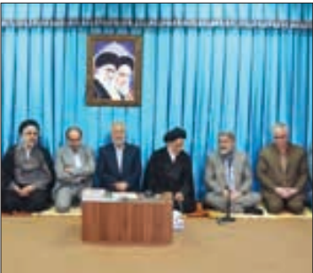
استاندار جدید خراسان جنوبی با مدیران و نمایندگان استان در دیدار با وزیر کشور.