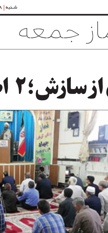
نماز جمعه اسلامیه

استاد– امام جمعه موقت دیوهک نیز در جمع نمازگزاران این شهر،با اشاره به ۲۰ خردادروز جهانی صنایع دستی، به قابلیت های مهم صنایع دستی