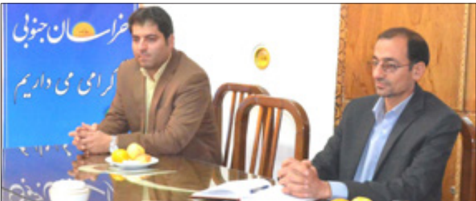
توصیف مدیرکل از داشته های محیط زیستی استان