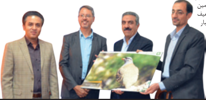
اگر شرایط مدیریت نشود شاهد از بین رفتن پوشش گیاهی به هر دلیلی باشیم طی دهه آینده، استان درگیر پایدیده گرد و غبار خواهد شد