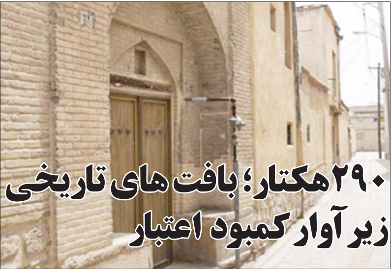
خیابان تاریخی در یزد

دکتر «زنگویی» می‌گوید: این مثل را درباره کسی می‌گویند که به دلیل چهره زشت و منکر یا حضور غیر منتظره و سخن نسنجیده اش موجب مرگ، سکنه یا هول و هراس دیگران می‌شود.