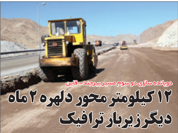
دوبانده سازی دو سوم مسیر بیرجند- قاین

قرار است پرونده ۱۰ ساله دوبانده سازی محور بیرجند- قاین امسال بسته شود تا از ۱۴۰۰ کاربران جاده ای، محور دلهره را بدون ترس، طی طریق کنند اما خبری که بر این موضوع صحه می گذارد این که ۱۲ کیلومتر دیگر از این محور تا دو ماه آینده زیر چرخ خودروهای این مسیر قرار می گیرد تا قطعات دوبانده سازی شده دو سوم مسیر را در بر گیرد. به گزارش «خراسان جنوبی» ۲۳ اردیبهشت امسال استاندار در حاشیه بازدید از منطقه ویژه اقتصادی خراسان جنوبی، از نهایي شدن ۵۰ میلیارد تومان اعتبار ماده ۵۶ برای تکمیل محور بیرجند- قاین خبر داد و بعد از چند روز نیز ۱۲/۵ میلیارد تومان از این منابع به حساب