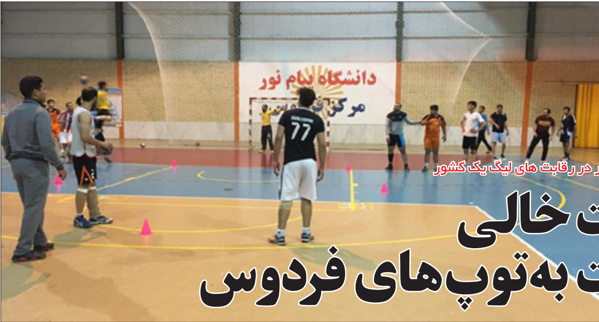
در آستانه حضور در رقابت های لیگ پگ کشور

وی افزود: فدراسیون در ۹ ماه گذشته مسابقه خاصی برگزار نکرد اما از طرف گروه در ۶ ماه نخست سال رقابت های مجازی آمادگی جسمانی، اجرای تکنیک دست و پا برگزار شد که در سه دوره متوالی به نفعات برتر از طرف گروه هدایایی داده شد. او ضربه مهلک کرونا به ورزش را مهم ترین چالش پیش رو بیان کرد و افزود: با توجه به این که همه فضاها از جمله مدرس، مجازی شده است، تنها دلخوشی نوجوانان و جوانان همین ورزش است که با شیوع کرونا ورزش هم تعطیل شد که این تعطیلی، ضربه بزرگی به مربی ها و ورزشکاران وارد کرد. به طوری که همه آن ها را خانه نشین یا راهی کوچه و خیابان کرد و دیگر فضایی برای یک تفریح سالم وجود ندارد. او با تاکید بر این که سیاست تعطیلی ورزش اشتباه بود و تبعات آن در دوران پساکرونا مشخص خواهد