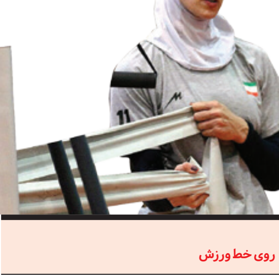
روی خط ورزش

به گفته وی بنابر نظرات ارائه شده، لیگ برتر بانوان سال ۹۹ در دو گروه مقدماتی و به صورت متمرکز در چهار هفته برگزار خواهد شد که تیم پیکان تهران در گروه «ب» قرار گرفته است.