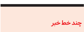
چند خط خبر

«حجت الاسلام «محسنی» امام جماعت و رئیس کانون نیکوکاری مسجد غدیر قاین گفت: بیش از هزار سید کالا از سوی کانون نیکوکاری غدیر شهرستان بین نیازمندان هفت روستای قاینات توزیع می شود.