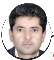
اقدام عملی طرح اقدام ملی در قاینات

آبادانی در چند قدمی شهرها و روستاهای قاینات