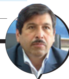
مدیرعامل آبفای استان:

احداث تصفیه خانه قاین به بخش خصوصی واگذار می شود