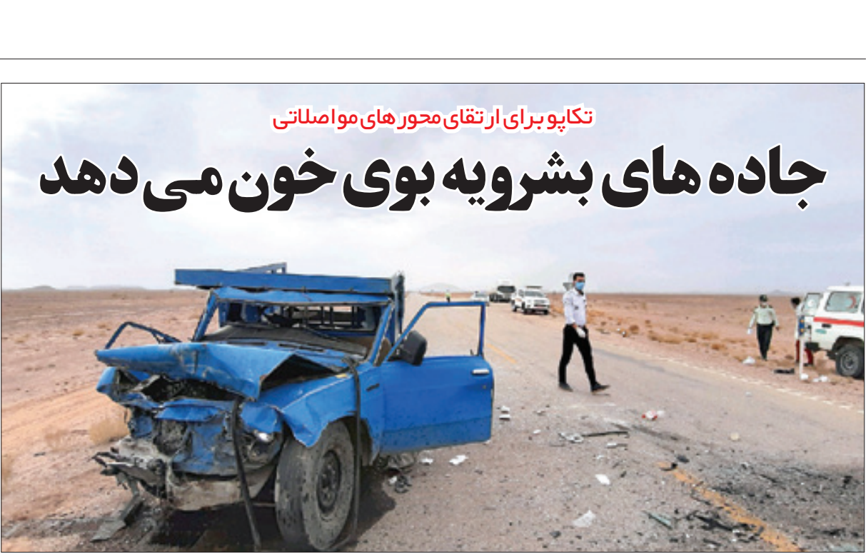
تکاپو برای ارتقای محورهای مواصلاتی