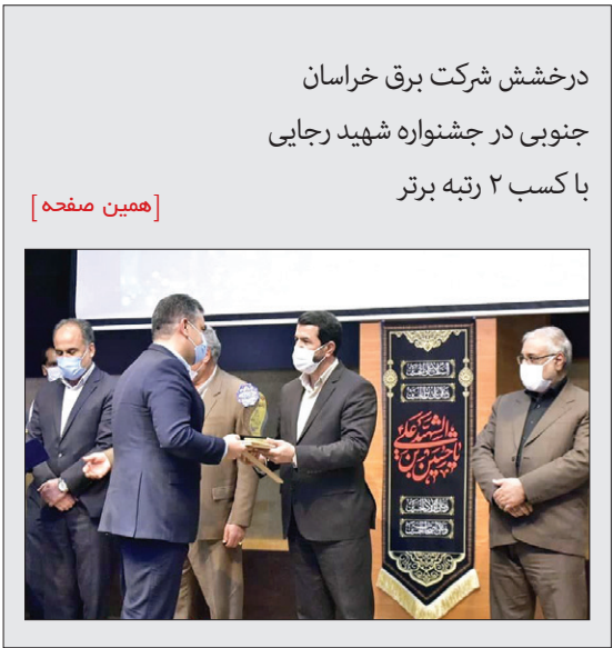
درخشش شرکت برق خراسان جنوبی در جشنواره شهید رجایی با کسب ۲ رتبه برتر