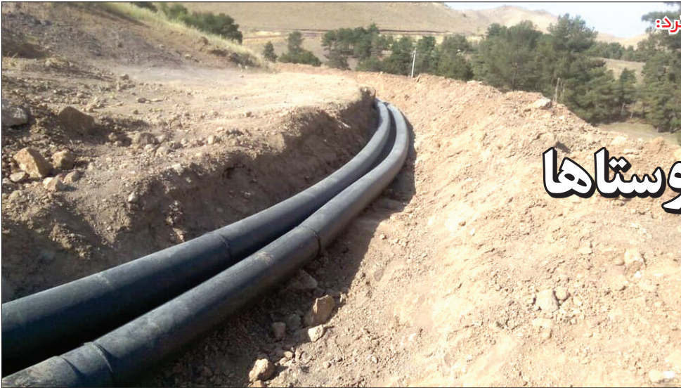
مدیرعامل شرکت آب و فاضلاب اعلام کرد؛