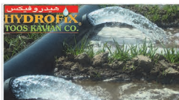
لوله هیدروفیکس دریچه دار