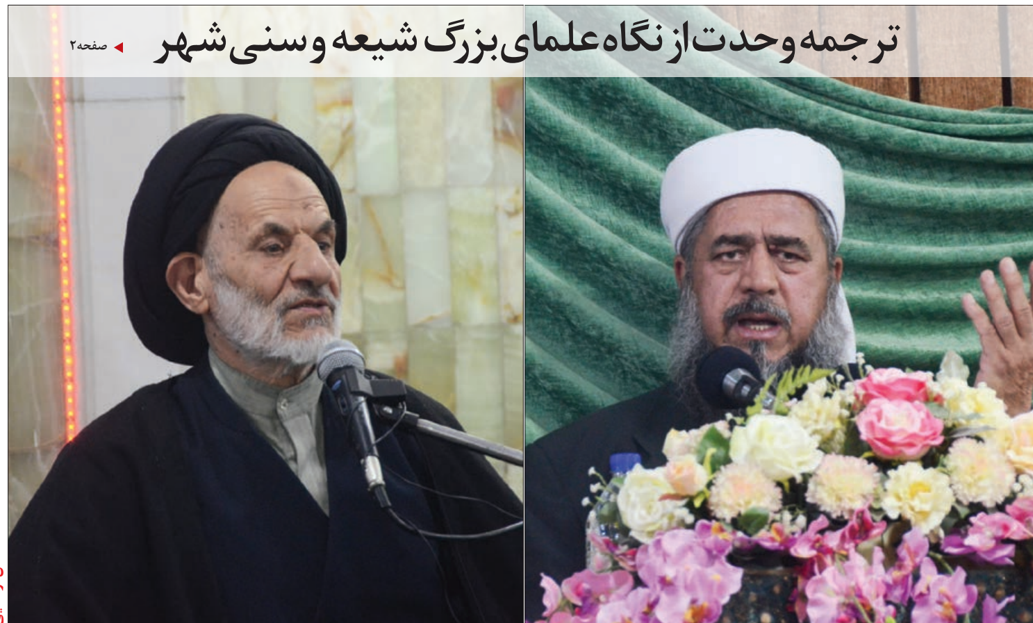
ترجمه وحدت از نگاه علمای بزرگ شیعه و سنی شهر